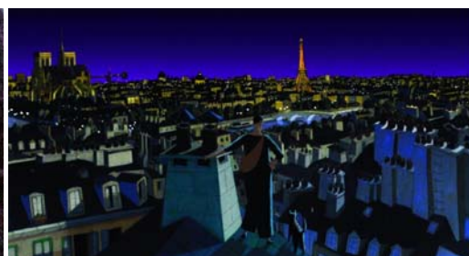
line via de chert & folimage