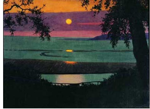
Coucher de soleil