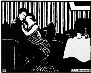
Le mensonge, Félix Vallotton

Evocation libre de ses impressions, sans souci de justesse autre que celle de ses sentiments. Respect et tolérance pour les avis partagés.