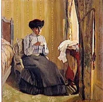
Femme cousant dans un intérieur