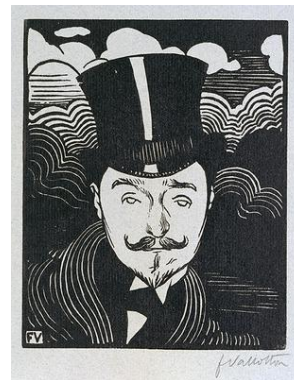
Portrait de Romain Coolus