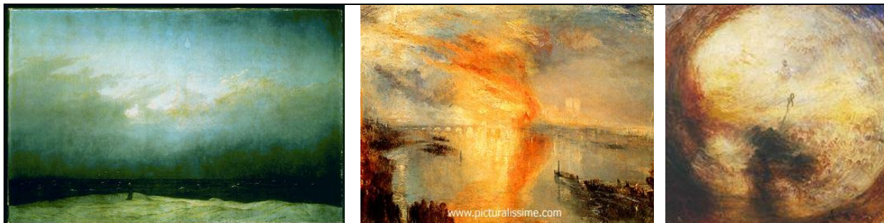
William Turner, L'incendie du parlement (1804) William Turner, Le matin après le déluge (1843)

Consignes : Donnez votre avis sur ces peintures, ce qu'elles évoquent pour vous ? Aimez-vous cette peinture ? Qu'est ce qu'elle représente pour vous, à quoi elle vous fait penser ? Pourquoi l'apprécies-tu ? Pourquoi ne l'apprécies-tu pas ?