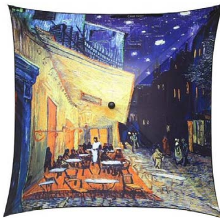
Toiles de Marc-Aurèle Fortin et de Van Gogh