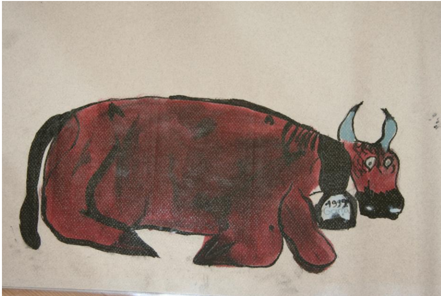
« Ma vache est têtue...si elle ne veut pas avancer, elle se couche. Les gens ont rit en la voyant ! »