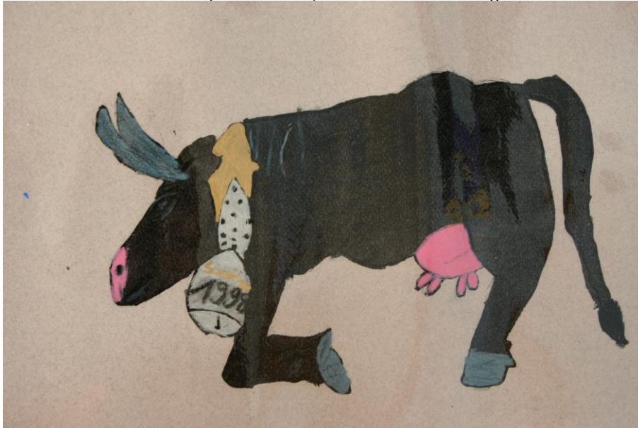
« Ma vache voulait se battre durant le cortège...Elle était énervée ! »