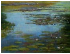
Waterlilies, de THOMAS Peter

http://www.festivaldupastel.com/pastel/art_pastel.php [09.03.08]