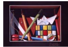
Hélice japonaise, DECOBERT David