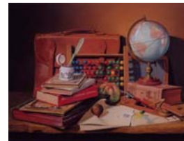
Nostalgie, de CANAT G Chr.