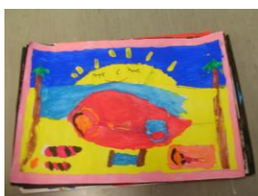
Les vacances au soleil