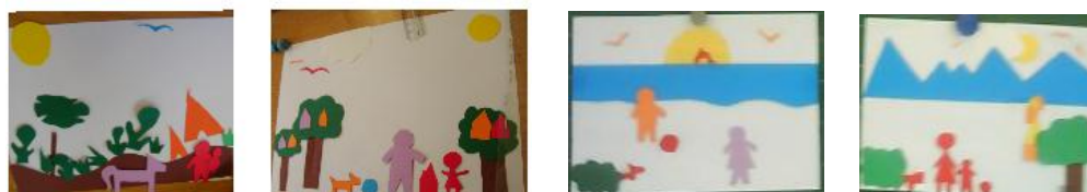
Ci-dessus : œuvres d'élèves et de la maîtresse sur feuille A4 lors de la première étape de la perception.