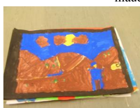
L'homme et le désert