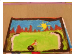
L'« Euro foot »