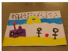
Mes vacances à la plage