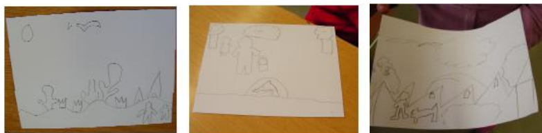
Ci-dessus : œuvres d'élèves sur feuille A5 lors de la phase 3 (T)