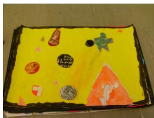
L'homme et la pyramide maudite