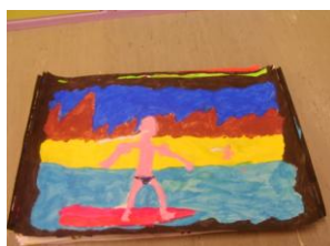
Le surfeur dragueur