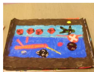
Le sous-marin nucléaire