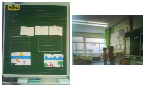
Mise en place dans la classe (correction et déroulement)

Je vais leur donner des objets que j'ai moi-même réalisés en papier-carton (surtout des personnages divers ou en rapport avec notre sujet, vu que l'on va dessiner sur le thème « des bonshommes en folie » !).