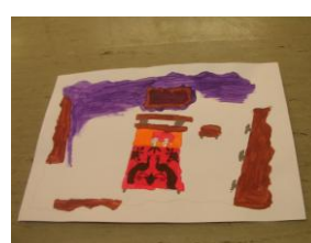
Ma chambre imaginaire