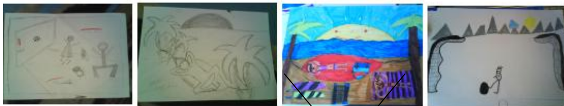
Trop poussé plus une esquisse