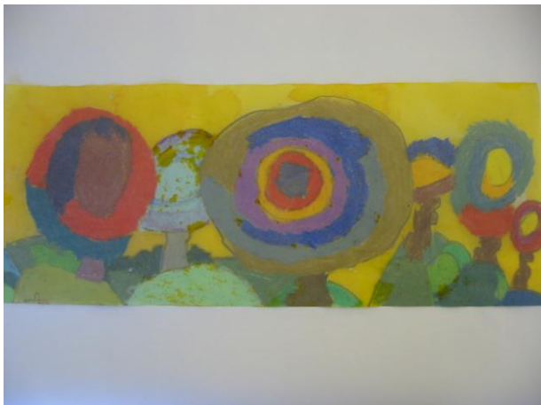
huiler le dos du travail