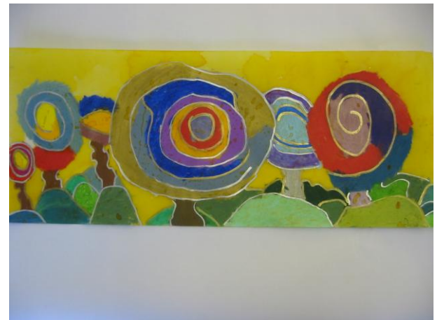
un cerne doré