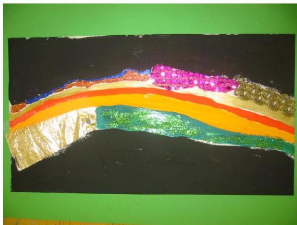
Un arc en ciel Arnaud M.