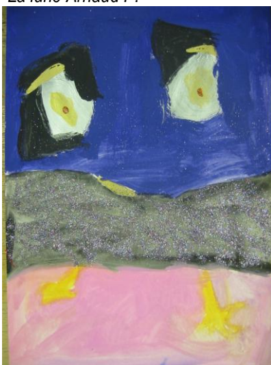
Les yeux du hibou Cécilia