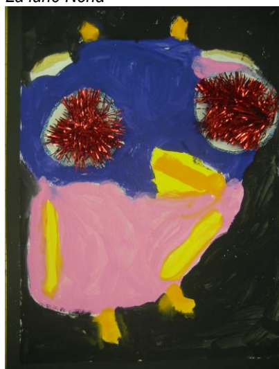
Les yeux du hibou Chloé