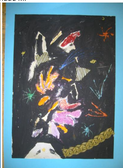
Un feu d'artifice Julien