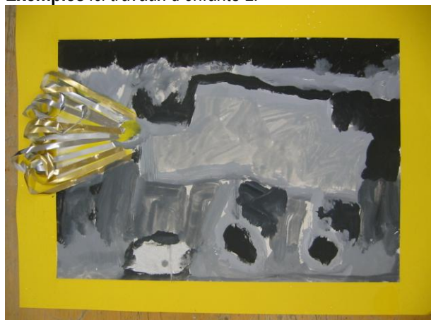
Les phares de la voiture de papa Colin