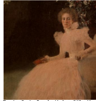
Portrait de Sonia Knips (Klimt)