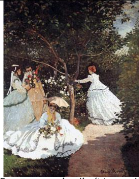
Femmes au jardin (Monnet)