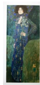
Portrait d'Emilie Floge de Gustav Klimt