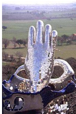
Le magicien de Niki de Saint-Phalle (Jardin des tarots, Italie)