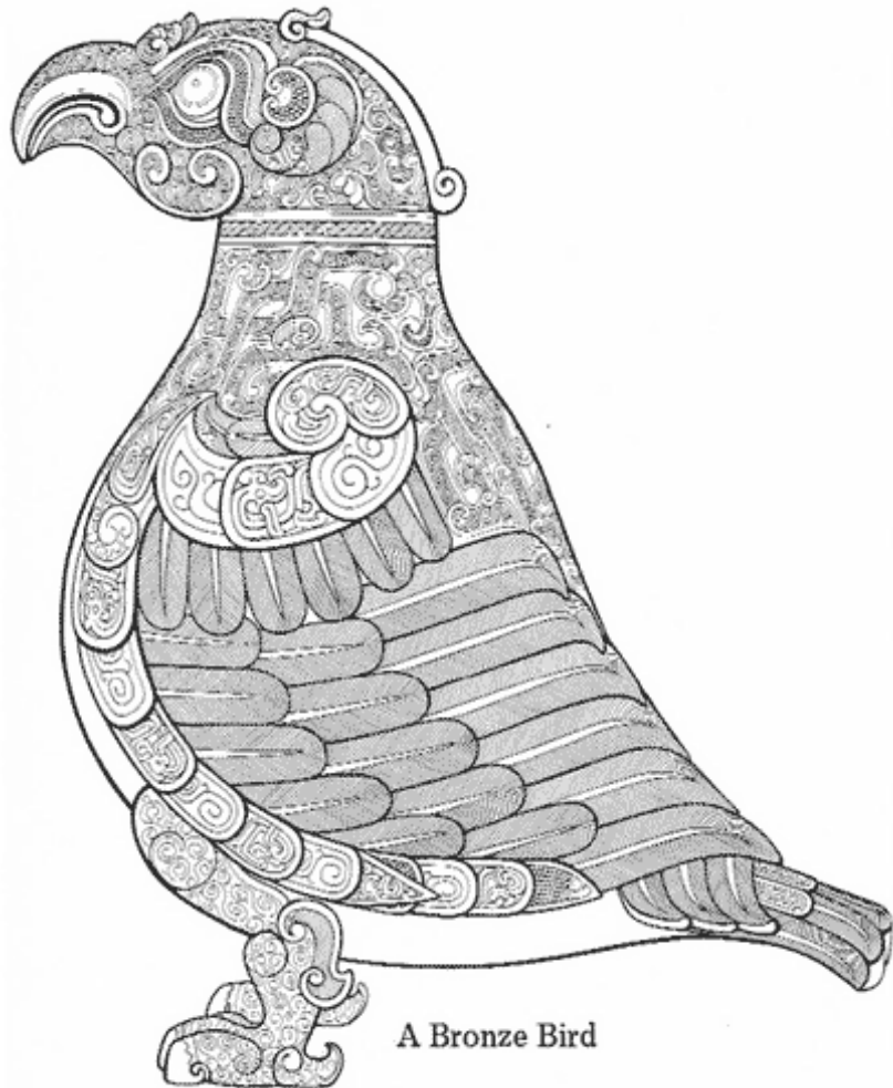
A Bronze Bird

A bronze vessel from the Late Zhou dynasty, 6th century B.C.