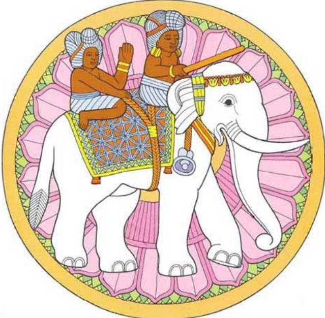
Voyageurs en éléphant de Mathura 2 e siècle après J.-C