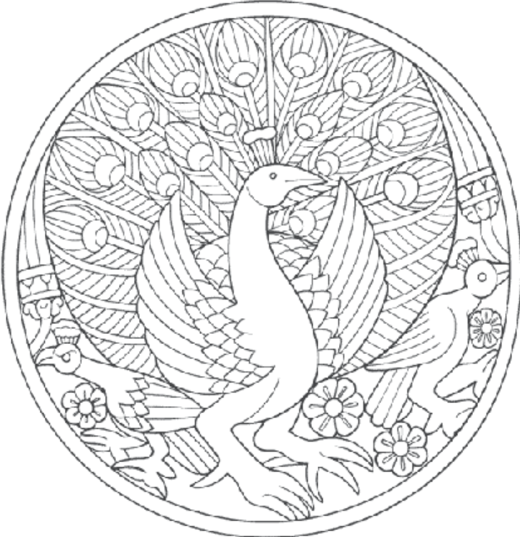
Skanda, le fils de Siva, devint le seigneur de la guerre. Le paon est le tueur du temps et un symbole de l'immortalité