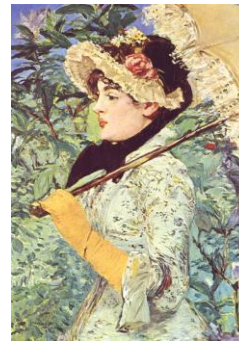
Vincent Van Gogh Auguste Renoir Printemps