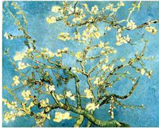
Claude Monet Le printemps 1886