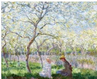
Amandier en fleurs 1890